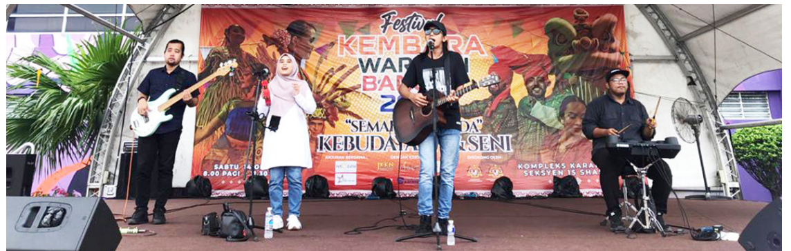
Persembahan Genji Buskers yang menghiburkan ketika Festival Kembara Warisan Bangsa 2023.

"Aktiviti ini bukan sahaja menyihatkan, malah secara tidak