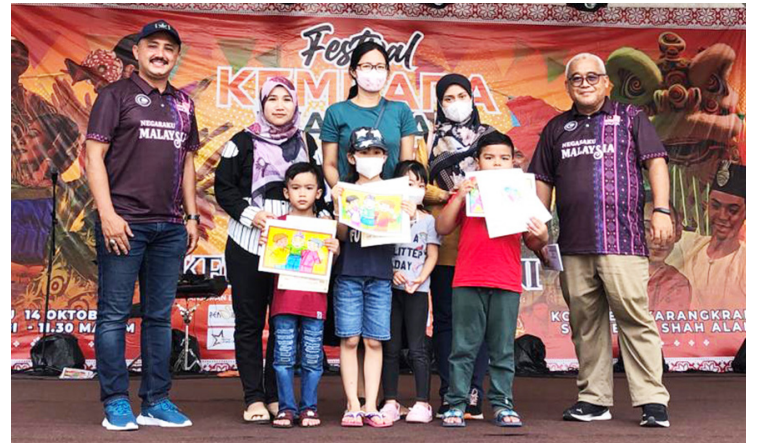
Pemenang pertandingan mewarna Festival Kembara Warisan Bangsa 2023 bergambar bersama hadiah masing-masing.